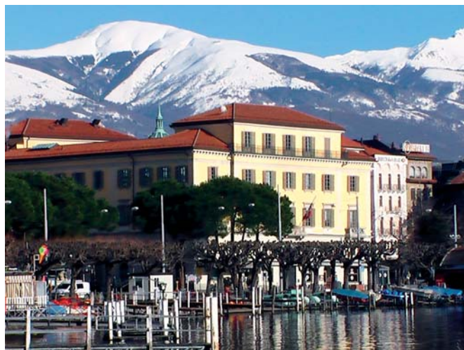
■ Luganói látkép

– Mindenféle kedvezményt adunk egyéni elbírálás alapján, ezt a térítéses juttatási szabályzat tartalmazza. A táplálkozástudományi MSc-képzés levelező lesz, tehát mellette dolgozhatnak a hallgatók, így jobban tudják finanszírozni tanulmányaikat.