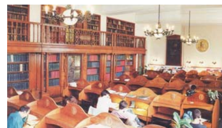
■ Lesesaal der Bibliothek (2008)

Es ist mir eine Ehre, bei diesem historischen Anlass als 1. Vorsitzender der Deutschen Studentenvereinigung eine Rede halten zu dürfen und somit auch den deutschsprachigen Studienzweig zu erreichen.