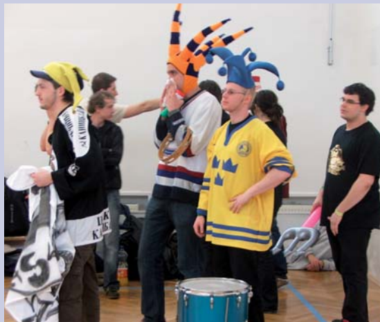
■ Szurkolók a Medikus Kupán

Nagy sikerrel, megannyi ifjú tehetséget megmutatva zajlott idén tavasszal a harmadik Semmelweis Egyetemi Kulturális Napok. A rendezvénysorozat idején tartották a sportnapot és a fesztivált is, amelyek szintén nagy sikert arattak. Az eseményekről bővebben következő számunkban olvashatnak, csakúgy, mint a Medikus Kupa Pécsen tartott viadaláról, és a végeredményekről. Kiemelendő, hogy 11 külföldi hallgató is erősítette az egyetemi csapatot. A következő medikus sportviadalra a Semmelweis Egyetem fogadja a hazai négy egyetem orvostanhallgatóit.