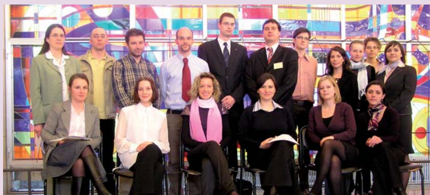
■ Díjazottak egy csoportja