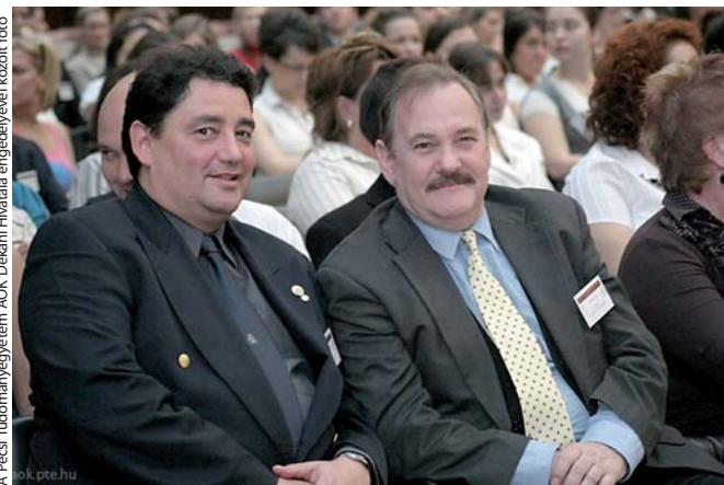
A Pcsi Tudomnyegyetem AOK Dekni Hivatala engedlyvel ksztt for