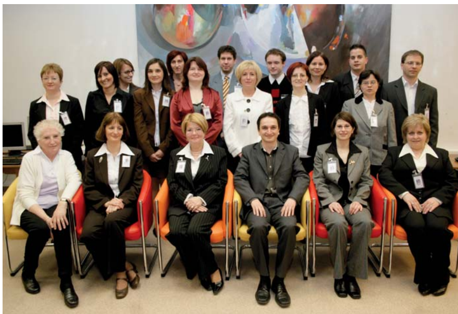
■ A könyvtár munkatársai

Az Országos Dokumentum-ellátási Rendszer tagkönyvtára így rendszeres támogatásban részesül az OKM-től. 24 órán belül szolgáltatott eddig könyvtárközi kölcsönzést a nyomtatott és az online forrásanyagaiból. A leg hosszabban nyitvatartó könyvtárak közé tartozik. Részt vesz a TÁMOP pályázatban konzorciumi tagként, az EISZ megbízásából is szervez és vezet konzorciumot, mindemellett a MOKSZ elnökség székhelye. A Központi Könyvtár jelentősen támogatja az ország orvosi szakirodalom ellátottságát: az Informatio Medicata előállításával.