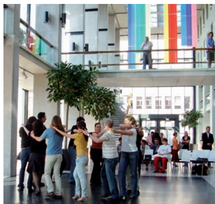
■ Tánc az EOK-ban

A szervezők célja nem a hallgatók és dolgozók megmérettetése volt ezúttal sem, hanem az, hogy felszínre hozzák a társaikban rejtőző értékeket, melyekre az előadói padokban vagy a körtermi gyakorlatokon nem derül fény. Valóban Albert Schweitzer bölcs gondolata fémjelzi mind az eseménynek, mind eszmeiségének lényegét: „Az ember csak akkor erkölcsös, ha magát az életet tartja szentnek, a növényekét és az állatokét épp úgy, mint az emberét, és igyekszik a lehetőségekhez képest segítséget nyújtani minden szükségét szenvedő életnek. Az élet tisztelése által lelki kapcsolatba lépünk a világgal. Néha kialszik bennünk a fény, de aztán ismét felgyúl, ha találkozunk egy másik emberi lényvel. Mindannyian óriási hálával tartozunk azoknak, akik képesek újból felgyújtani ezt a belső fényt.” Ez idén is kiválóan sikerült, és hálát adunk a melegért és fényért.