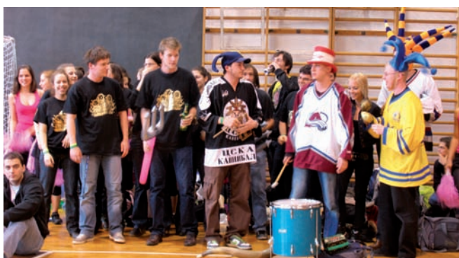
■ Szurkolók Pécsen

A díjkiosztó ünnepség kis késéssel kezdődött. A várakozást az egyetemi szurkolók műsora tette színesebbé. Saját rigmusuk mellett a többi egyetem hallgatóit is külön köszöntötték. A kis műsor után mintegy 500 fő harsogta a szimpatikus csapat, szimpatikus csapat rigmust, így köszönve meg a Semmelweis Egyetem szurkolóinak műsorát. Jövőre Budapesten lesz a verseny, szóval