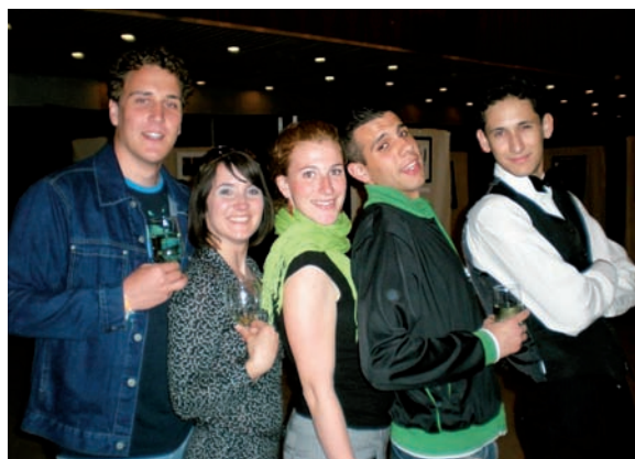
■ A műsor remek, mi is azok vagyunk

Az tény, hogy a szervezők az SE-ÁOK Hallgatói Önkormányzat, az Instruktor Öntevékeny Csoport Egyesület, a Korányi Frigyes Szakkollégium, és állandó támogatókul a Marketing és Kommunikációs Igazgatóság,