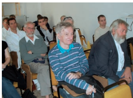
■ Katasztrófavédelmi felelősök

A Biztonságtechnikai és Logisztikai Igazgatóság Katasztrófavédelmi és Oktatási Csoportja a több éves hagyománynak megfelelően az idén is megszervezte az egyetem szervezeti egységei katasztrófavédelmi felelőseinek felkészítését. A rendezvényre az igazgatóság III. emeleti tantermében került sor április 28-án.