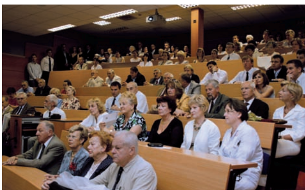
■ Az arcokon meghatódottság, elmélyült figyelem és felszabadult derűtség