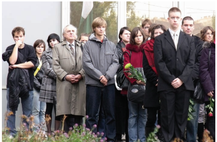
■ Az ünnepség közönségének egy része

Sajnos a személyes élmények sok részlete fél évszázad alatt elhomályosult, összemosódott. Másrészt, számos tragikus mozzanatot, amely élesen él emlékeimben, nem tudok pontosan felfűzni az idő fonálára. Ilyen emlék a nemzeti zászlóval letakart, sötétkékké ünnepi bányászgyegetruhában hanyattfekvő fiatal, krétafehér arcú munkásfiú teteme