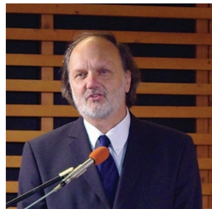
■ Karádi István professzor, az orvoskar dékánja, méltatja az ünnepeltet

Karádi István professzor, a Semmelweis Egyetem Általános Orvostudományi Karának dékánja Szabó professzort egy romantikus kaland hősénekként nevezte, aki jelen volt a magyar szívsebészet bölcsőjénél, és hozzásegítette felserdüléséhez az első magyarországi szívtranszplantáció sikeres elvégzésével. A dékán úr a hallgatóság