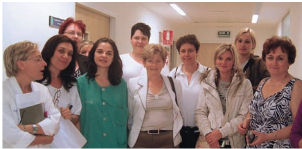
■ A magyar küldöttség tagjai

A látogatás fő célja volt a Szülészeti-Nőgyógyászati Osztály megtekintése és a spanyol-magyar kapcsolat erősítése.