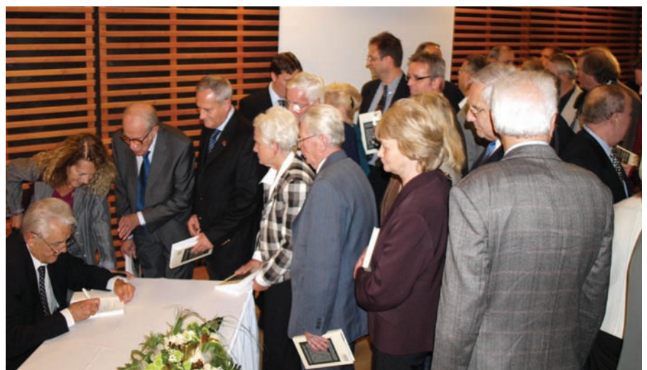
■ Kollégák, barátok és tisztelők dedikálásra várva