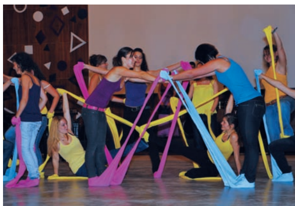
■ Színes harisnyák

A helyszín a szokásos, már talán az elsőévesek által is jól ismert NET, amelynek alsó szintjei az alkalomnak megfelelően egy kicsit másképp festettek, mint a hétköznapiakon: a dekoráció igazán bálhoz méltóra sikerült, és az így átalakult termek remek összhangot alkothattak az elegáns ruhát öltő vendégekkel.