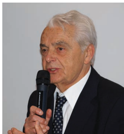
■ Szabó Zoltán professzor mesélve tanít

megvalósulhattak a legmodernebb szívsebészeti eljárások. A nemzetközi hírv szívsebész kitaró munkásságának főbb eredményei között szerepel a hazai motoros szívűtékek és a szívritmus-szabályozó (pacemaker) kezelés elterjesztése, a biológiai típusú szívbillentyűműtékek beve-