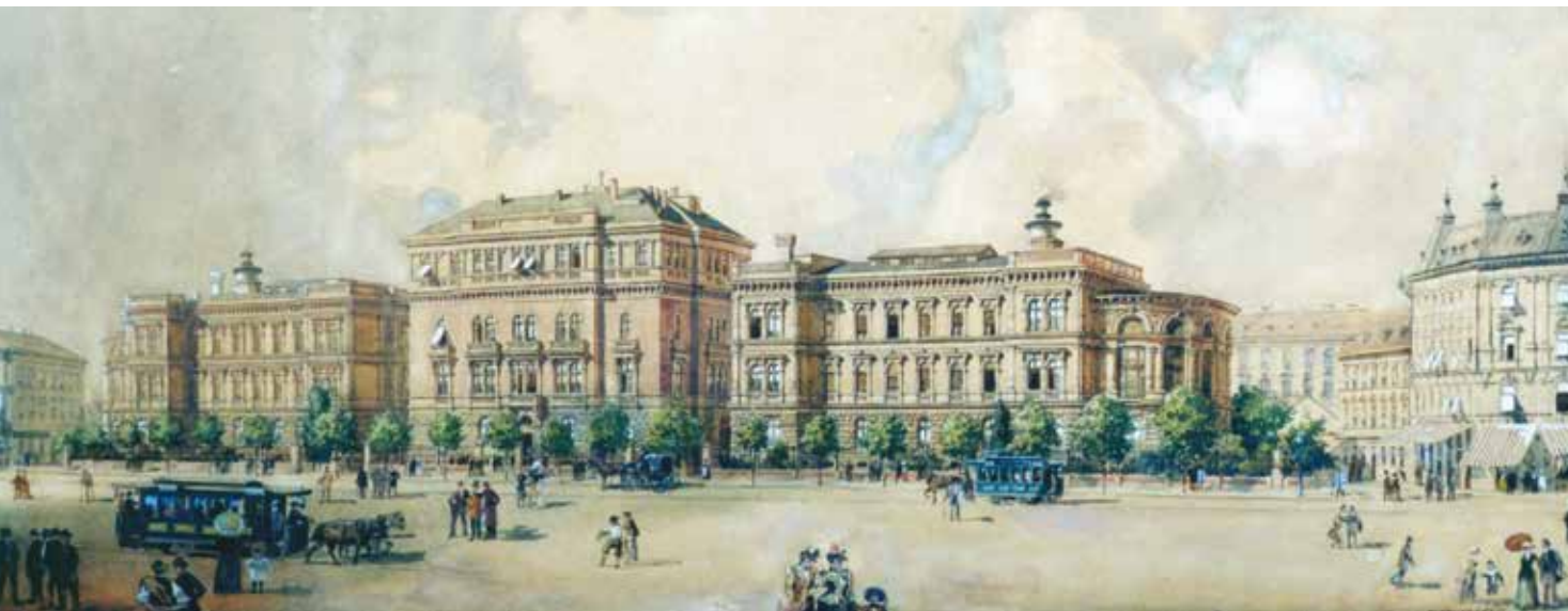
Az egyetem épülete korabeli festményen. Mirkovszky Géza (1855–1899) akvarellje