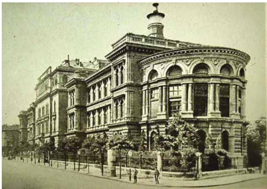
Az Üllői úti klinikák és rektori épület

okozott az Orvoskar életében. A front közeledtével az oktatászményzet nagy részét mozgósították, és megkezdődött az egyetem kiürítése. A háború alatt hatalmasak voltak a károk, és elpusztult a felszerelések jelentős része is.