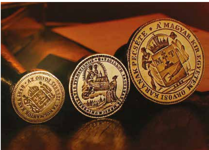
Pecsétnyomók. Középen az orvoskar első pecsétje 1770-ből, kétoldalt az első magyar nyelvű kari pecséték 1848-ból

A II. világháború 1944-ig az oktatókat is érintő katonai szolgálaton és a sebesültellátáson kívül különösebb zavart nem