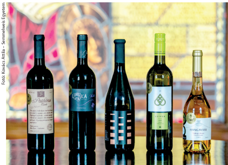
Fotó: Kovács Attila – Semmelweis Egyetem

Kommunikációs és Rendezvényszervezési Igazgatóság