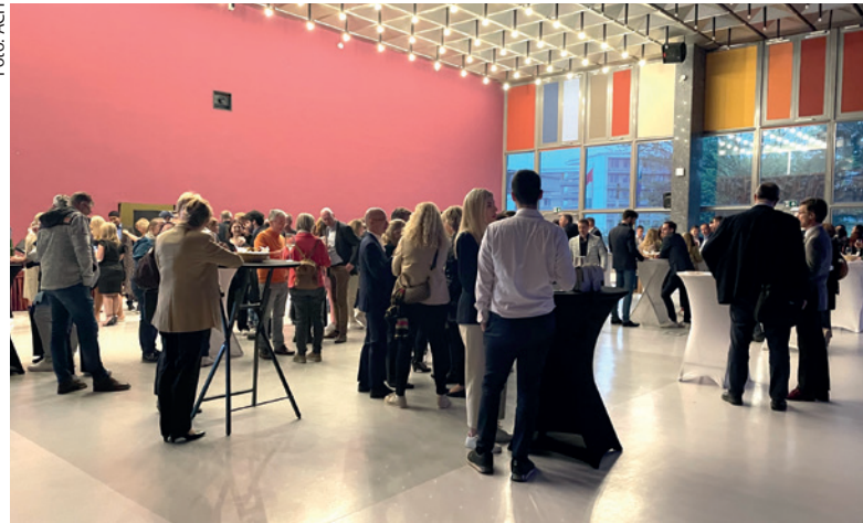
Ehemalige Studierende der Semmelweis Universität beim Get-together an ihrer Alma Mater

sche Leiterin der Studentischen Angelegenheiten am ACH, war begeistert von dem bestens organisierten Event, den vielen interessanten Gesprächen und dem abwechslungsreichen Rahmenprogramm und nimmt viele Anregungen für die gemeinsame Alumni-Arbeit am ACH mit.