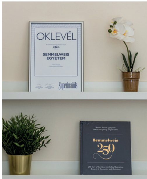
Tasnádi Róbert Kommunikációs Igazgatóság

Kilenc egymást követő évben, összesen tíz alkalommal nyerte el a Semmelweis Egyetem a Superbrands Díjat. A többlépcsős szakmai kiválasztási folyamatban odaítélt díj a kimagasló minőség és a márkaépítésbe fektetett munka elismerése.